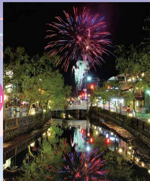
※写真は全てイメージです