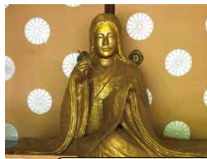
廬山寺 紫式部座像