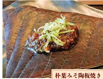
朴葉みそ陶板焼き

A5飛騨牛など、地場食材をふんだんに使った「奥飛騨和(なごみ)会席」が一番人気です。田舎に帰ってきたような「ほっこりと和める」料理で奥飛騨の四季を感じていただきたいと思います。