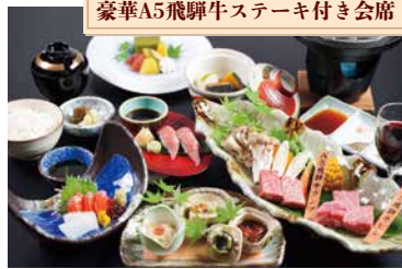
豪華A5飛騨牛ステーキ付き会席

親元を離れ、岐阜市内の料亭に住込みながら高校(調理科)に通ってました。昼は高校、夜や休日は料亭で修行といった二重生活で、部活もできず、友達と遊びに行くこともできませんでした。