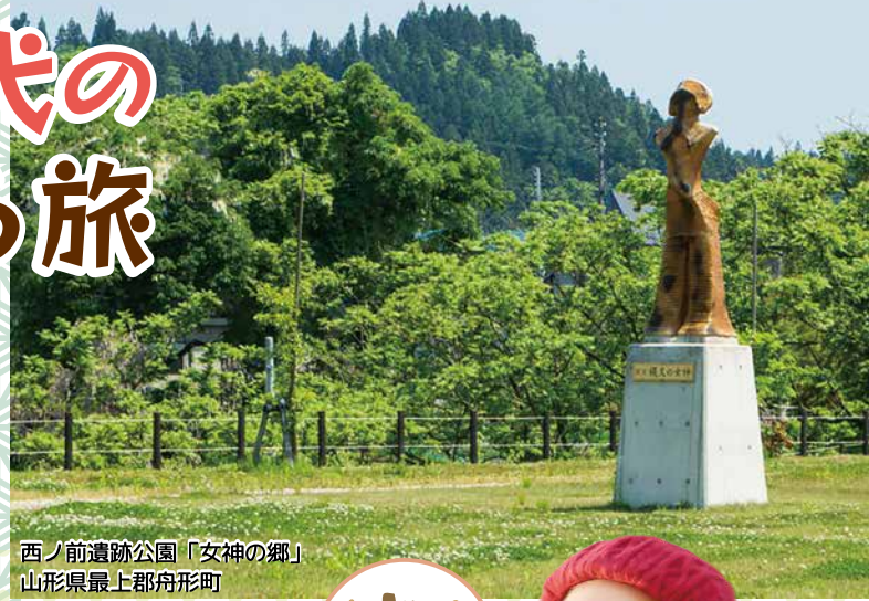
西ノ前遺跡公園「女神の郷」 山形県最上郡舟形町

KKR 宿泊施設に近い博物館を巡り、縄文時代の暮らしや文化に関する知識をアップデート。新潟県の笹山遺跡から出土された火焰型土器を含む深鉢形土器 57 点は縄文土器としては国内第 1 号の国宝に指定されています。また、国宝に指定されている縄文時代の土偶 5 体のうち 4 体は、KKR 宿泊施設の近くで会うことができます。