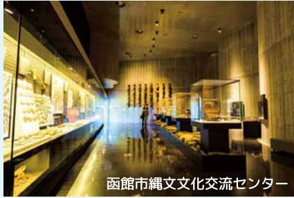
函館市縄文文化交流センター